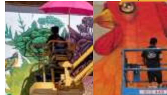
Malpegados Xile / Barcelona @MALPEGADOS Carrer Campcardós, 77 - Cami Pedraforca Façana