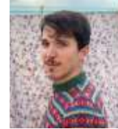
Rice Barcelona @ricebarcelona Col·legi Maristes Girona Mur [projecte social]