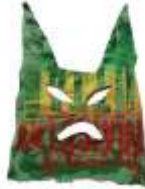
El Rughi Martina Franca (Itàlia) @el_rughi Col·legi Maristes Girona Mur