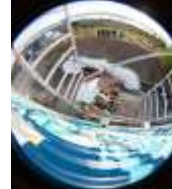
Saves Madrid @savess_ Carrer de les Gavarres, 20 Façana