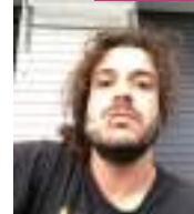
Pau Lo Barcelona @paulopezvila

Carrer Maçana, 57 Façana [projecte social +a'rT]