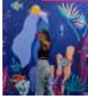
It's mancho Bogotá, Colòmbia @itsmancho