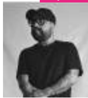
Píncel Barcelona @felipepíncel_art

Carrer Maçana / Riu Güell Façana Escola Santa Eugènia